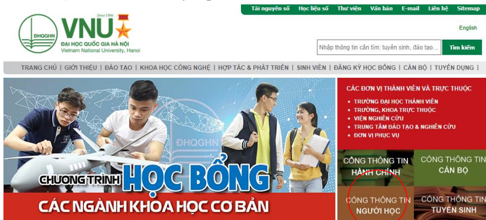
Hình 1: Vào cổng đăng ký thông tin người học qua website của ĐHQGHN

Để vào hệ thống, các bạn có thể trực tiếp vào địa chỉ daotao.vnu.edu.vn hoặc thông qua trang web của Đại học quốc gia vnu.edu.vn , tại mục Đăng ký thông tin người học (xem Hình 1) với các trình duyệt phổ biến.